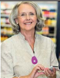
GPS Mobile Above

No Contract • No Fees • Easy Setup • md-medalert.com CALL 800-890-8615