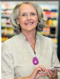
GPS Mobile Above

No Contract • No Fees • Easy Setup • md-medalert.com