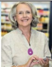
GPS Mobile Above

No Contract • No Fees • Easy Setup • md-medalert.com CALL 800-890-8615